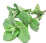
MENTHE POIVRÉE (vivace)

EST UTILISÉE DANS UN GRAND NOMBRE DE PLATS: TERRINES VIANDES GLACÉS ETC. ON PEUT AUSSI EN FAIRE DES TISANES OU DU THÉ. VIVACE VIGOUREUSE TRÈS FACILE À CULTIVER.