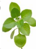
OREGANO GREC (vivace)

VIVACE. SERT À ÉPICER, ENTRE AUTRES, LES PIZZAS, SOUS-MARINS, SAUCES TOMATES ET PLATS MEXICAINS. FACILE À CULTIVER.