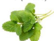
MELISSE OFFICINALIS (vivace)

COUSIN DE LA MENTHE PRODUISANT DE DÉLICATES FEUILLES DENTELÉES QUI DÉGAGENT UNE ODEUR DE CITRON. LES FEUILLES INFUSÉES DONNENT UNE AGRÉABLE TISANE RELAXANTE, QUE L'ON PEUT AGRÉMENTER DE MIEL.